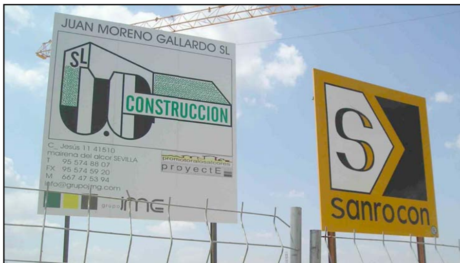
Carteles de las dos empresas de Mairena colocados en los terrenos del Centro de Salud.

Dicen que el que avisa no es traidor. El Partido Andalucista lleva luchando 25 años para que el Centro de Salud se ubicara en el Viso, porque eso sería bueno para nuestro pueblo.